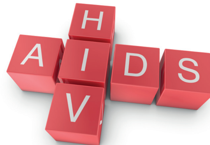
FL_079_02, Fotos: © fotolia

IMD Institut für Medizinische Diagnostik Berlin-Potsdam GbR